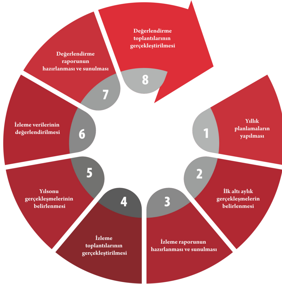
Şekil 2. İzleme Değerlendirme Süreci